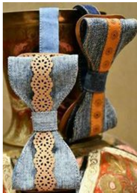
Heledam naiste ja meeste lips.

Meie kivilipsud on suunatud stiilitundlikele ja taaskasutust hindavatele inimestele. Pakume kivilipse nii meestele kui naistele. Lisaks on meil väiksemaid suurusi lastele. Teeme lipse julgete värvilahendustega, kui ka mahedamates toonides.