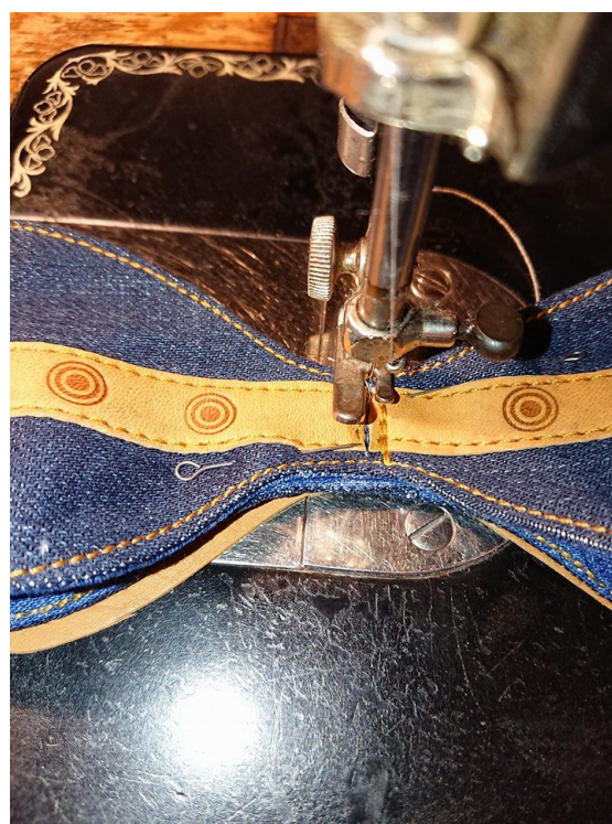
Pilt tootmise käigust.

Firmal on olemas ka oma visiitkaardid, millelt inimesed meie kontaktandmed leiavad.