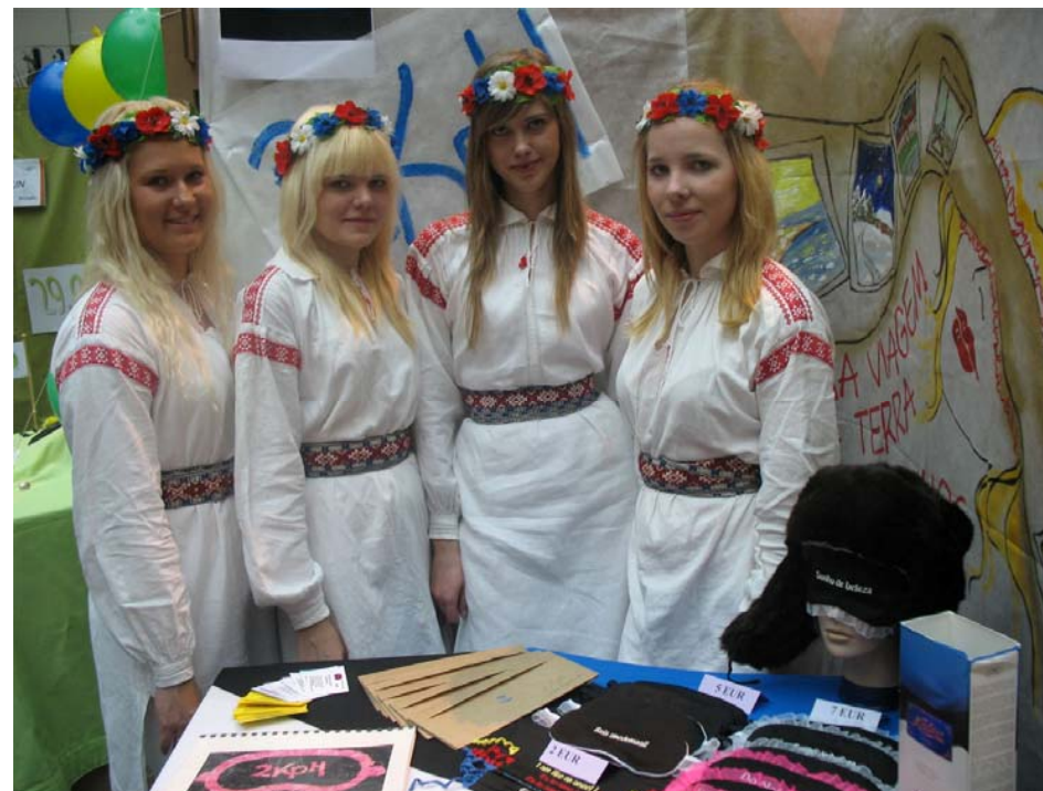
Õpilasfirma 2KpH Rahvusvahelisel Õpilasfirmade laadal Lissabonis

Sponsorite tänamiseks korraldame neile 23. aprillil tänuürituse. Üritusel räägime oma muljetest ja kogemustest, mille saamine sai võimalikuks just tänu nende toetusele.